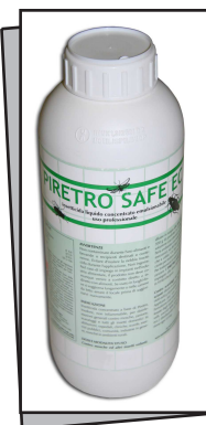
EC400501 PIRETRO SAFE EC concentrato - Confezione da 1 litro

Insetticida concentrato a base di estratto naturale di Piretro dotato di rapida azione abbattente e snidante ed effetto insetto – repellente. Su base acquosa. Ideale per ogni ambiente, tra cui gli ambienti sensibili: abitazioni, ospedali, scuole, industrie alimentari, magazzini e negozi alimentari, esercizi pubblici, collettività, verde urbano per trattamenti contro mosche, zanzare, scarafaggi, formiche, insetti delle derrate.