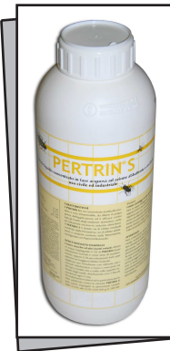
EC400502 PERTRIN S concentrato - Confezione da 1 litro

Insetticida concentrato a base di estratto naturale di Piretro dotato di rapida azione abbattente e snidante ed effetto insetto – repellente. Su base acquosa. Ideale per ogni ambiente, tra cui gli ambienti sensibili: abitazioni, ospedali, scuole, industrie alimentari, magazzini e negozi alimentari, esercizi pubblici, collettività, verde urbano per trattamenti contro mosche, zanzare, scarafaggi, formiche, insetti delle derrate.